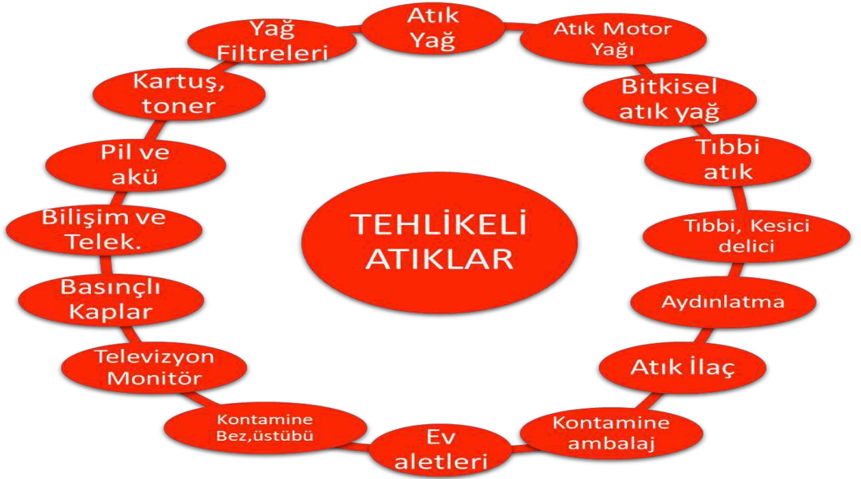
Resim-2: Tehlikeli Atıklar